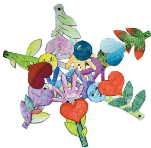
Il fiore del carattere

Responsabilità, pace, amore, retto agire, onestà, fiducia, collaborazione, coerenza, libertà, equità, lealtà, sono solo alcuni tra questi. Il percorso ha suscitato molto interesse e fatto scaturire delle profonde riflessioni e numerosi scambi in classe dando vita a svariate forme di espressione creativa.