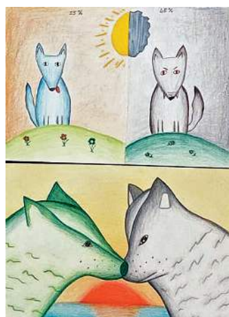
La leggenda dei due lupi