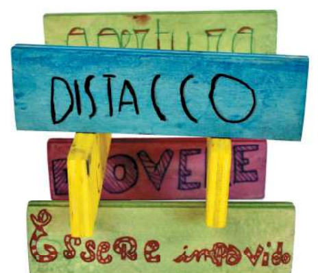
La mia scala dei Valori